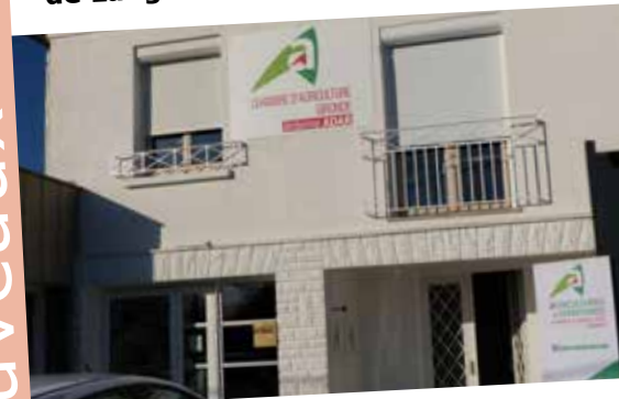
A Créon pour l'antenne ADAR des Deux Rives en 2017