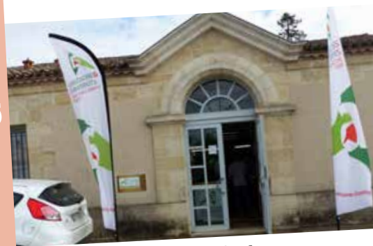
A Saint Emilion, création d'une nouvelle Antenne en 2017