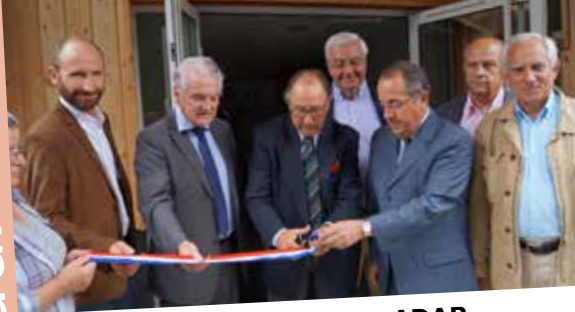
A Mazères pour l'antenne ADAR de Langon en 2014